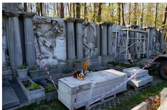
Probíhající rekonstrukce