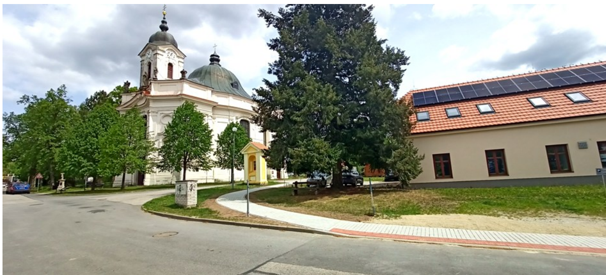
Nový chodník v Zacharově ulici