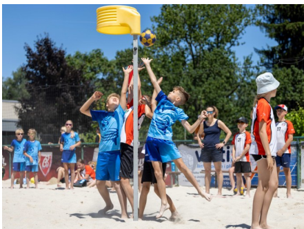
MČR beachkorfbal zápas proti KK Brno

Za všechny trenéry a příznivce korbale Vlastimil Krejčí