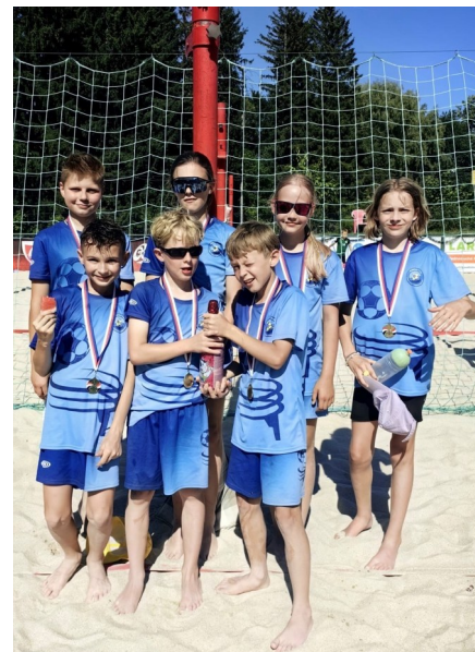
Mistrovský tým z MČR v beachkorbale

Všem našim hráčům, rodičům i fanouškům přejeme krásné a slunečné léto