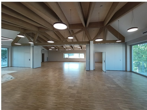
Dokončený interiér restaurace a sálu