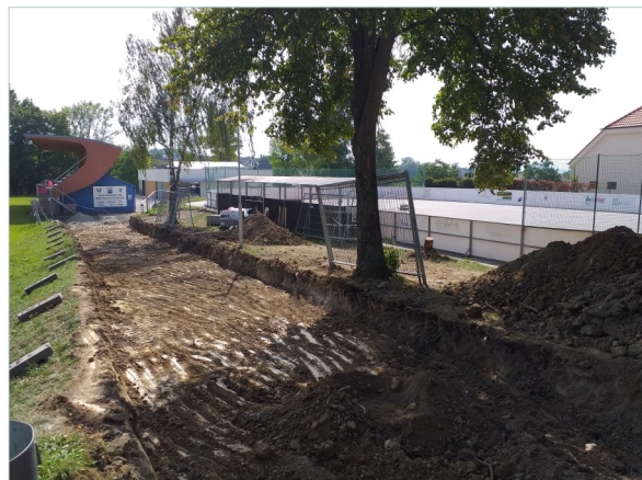
Úpravy příjezdové cesty