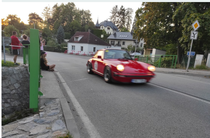
Vítězná posádka Porsche 911 Lambert-Loerke DE /DE