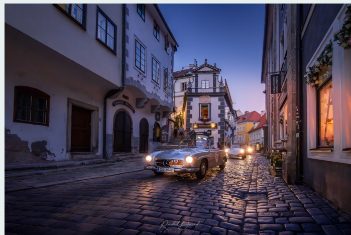
Průjezd na náměstí v Českém Krumlově