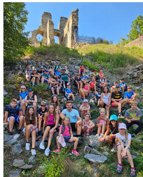
Výlet na Dívčí kámen