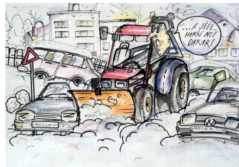
kresba: Gabriela Švehlová