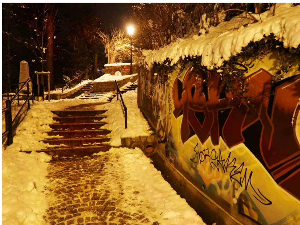
Večerní dobrovodské zákoutí