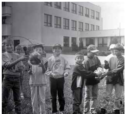
První žáci v nové škole