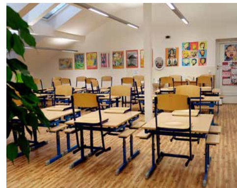
Nový školní ateliér