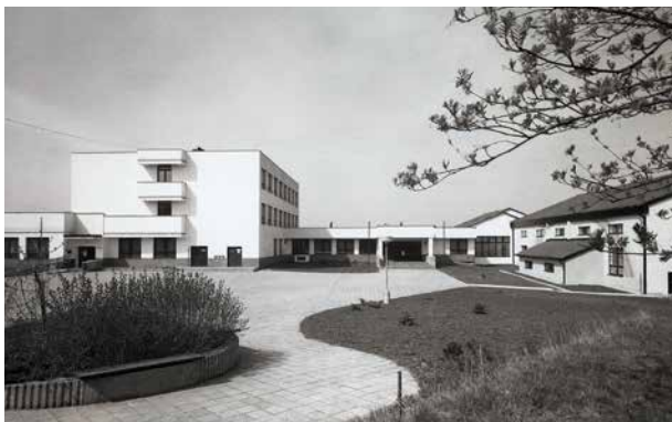
Pohled na budovu ze dvora (1996)